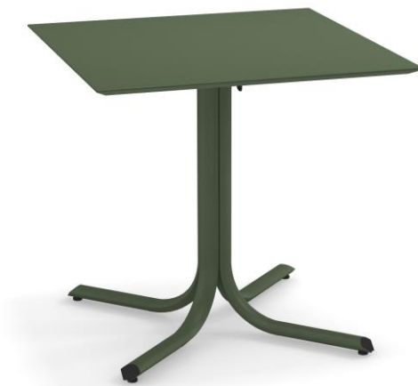
Table System ist die innovative Tischkollektion, entworfen im EMU Forschungs-zentrum, um den vielfältigen Ansprüchen des Objektgeschäfts gerecht zu werden; ein umfassendes Sortiment aus runden, quadratischen und rechteckigen Tischen mit festen und abnehmbaren Tischplatten. Diese Serie zeichnet sich durch die vielseitigen Einsatzmöglichkeiten aus, wobei die Tische sich ganz natürlich in jede Umgebung einfügen und sich mit allen Stühlen der EMU-Kollektionen kombinieren lassen.