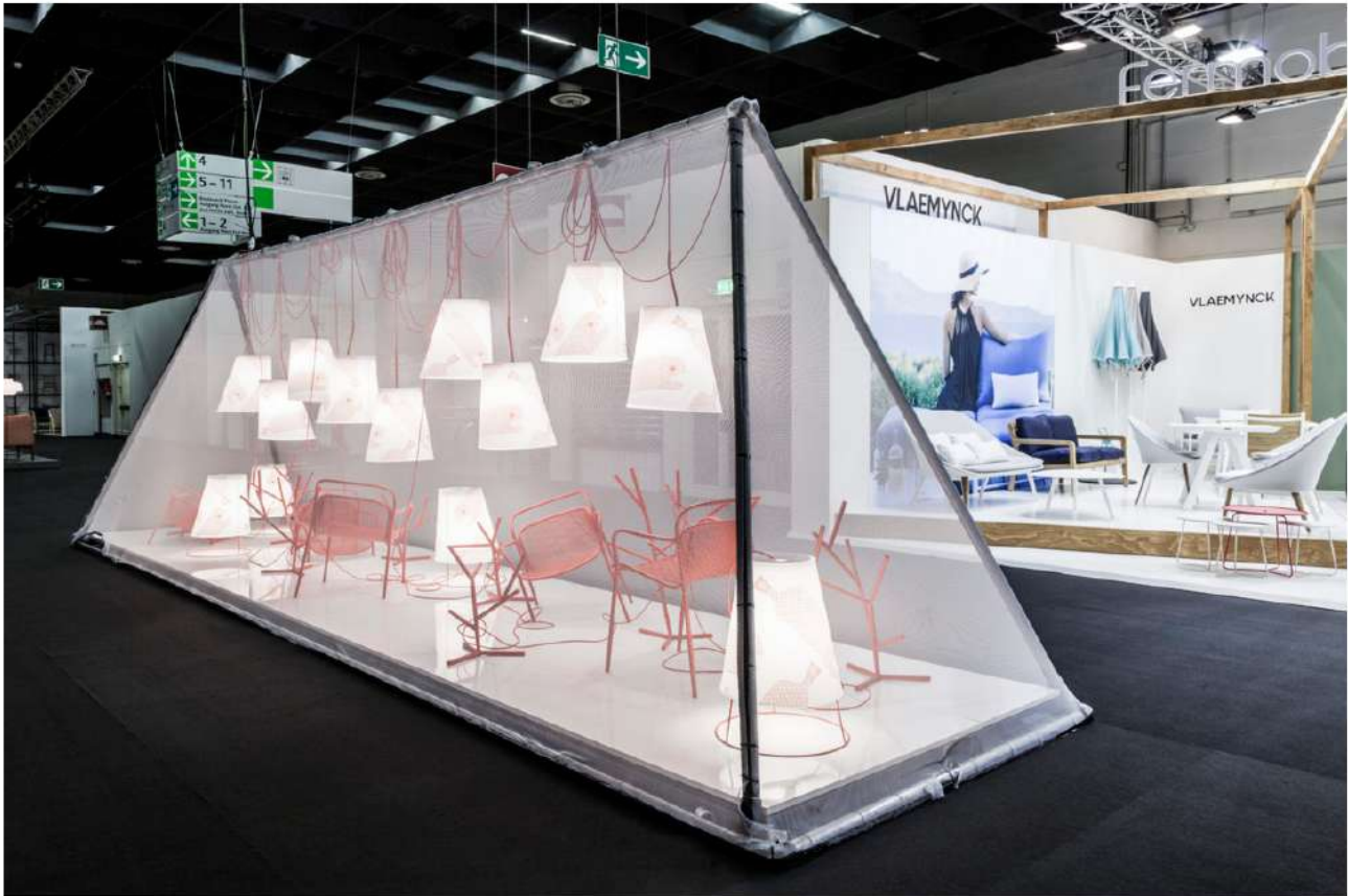
The winner of this years Featured Editions at the imm cologne: An installation by Emu with Studio Chiamonte Marin – inspired by the deep sea.