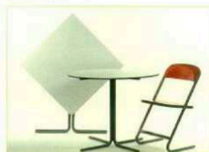
Coro, collection Zeta, chez Jardin Chic, table pliable, à partir de 998 €