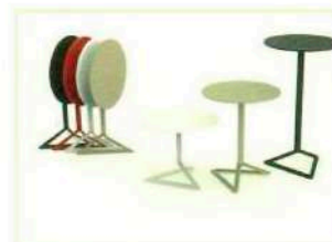
Vondom, collection Delta, table avec plateau HPL, 270 €, avec plateau en verre, à partir de 403 € ; chaise en polypropylène injecté avec fibre de verre, à partir de 120 €