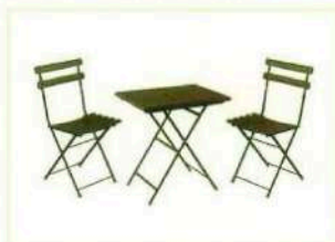
Emu, ensemble Arc-en-Ciel, chez Jardin Chic, lot de 2 chaises pliables à partir de 132 € ; table pliable, à partir de 139 €