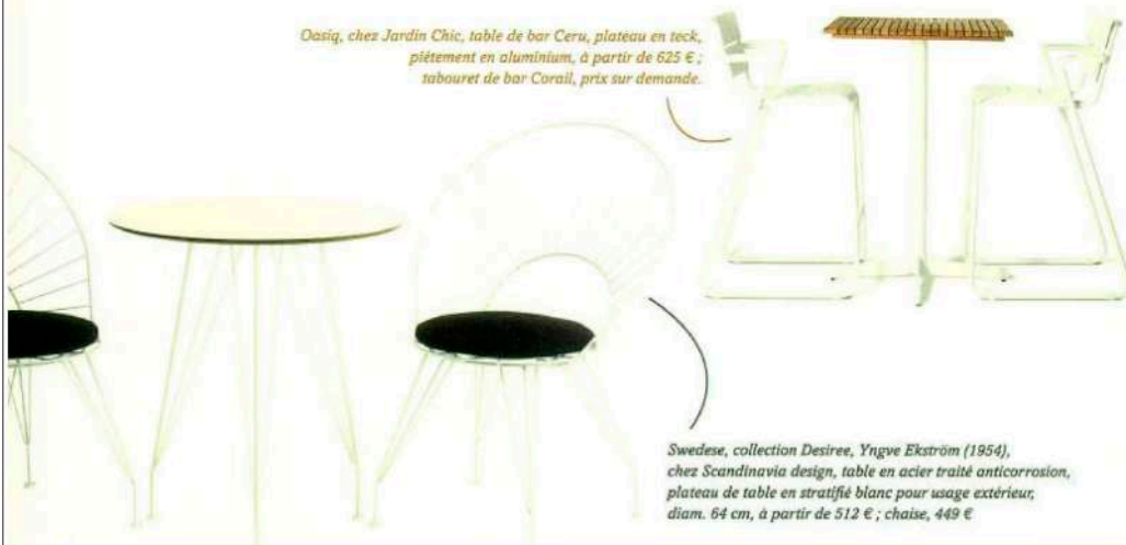
Swedese, collection Desiree, Yngve Ekström (1954), chez Scandinavia design, table en acier traité anticorrosion, plateau de table en stratifié blanc pour usage extérieur, diam. 64 cm, à partir de 512 € ; chaise, 449 €.