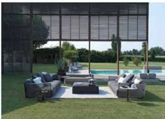
FLEXFORM, Vulcano. Design: Antonio Citterio - flexform.it

Ecology is no longer an optional extra. Although often associated with deforestation, teak is actually mostly sourced from forests that respect sustainable management policies (FSC, PEFC, among others). Royal Botania, for example, founded the Green Forest Plantation Co in 2011 and has grown more than 250,000 teak trees in the space of three years. Cassina has incorporated 100% recycled fibre into the filling of its cushions, made from PET, mainly recovered from the sea. Flexform's fabrics, leather, metal and wood come from sustainable and local sources and its goose down is also certified. Taking a weight off your mind as you take time out. ▶