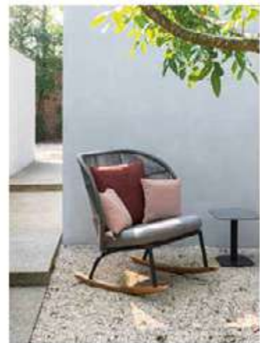
VINCENT SHEPPARD, Kodo Design: Studio Seghers - vincentstheppard.com