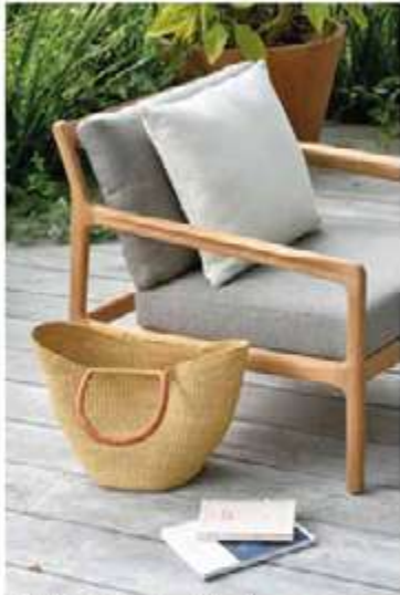
ETHNICRAFT, Iack - Design: Nathan Yong - ethnicraft.com