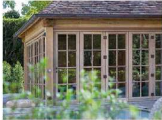
POULEYN-LLOYD HAMILTON. Poolhouse in oak - pouleyn.be