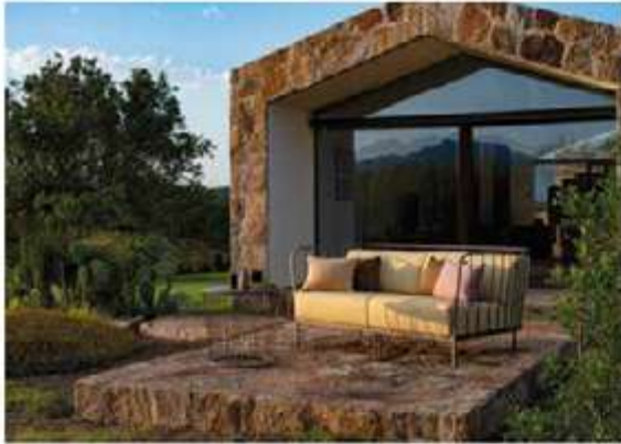
EMU. Canolé collection Filicudi Mood - Design: Anton Cristell and Emanuel Gargano - emu.it