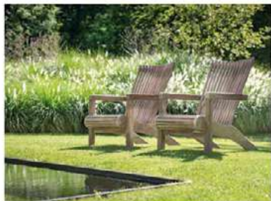
GOMMAIRE, Easy Chair Orso, naturel teak - gommeire.com