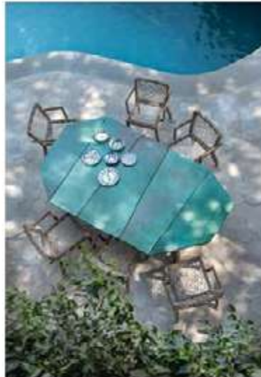
ETHIMO, Rafael dining set, Design: Paola Navone - ethimo.com