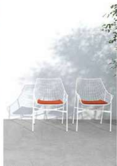
CARIMAR, Noon, Living Ceramics - carimar.be | livingceramics.com