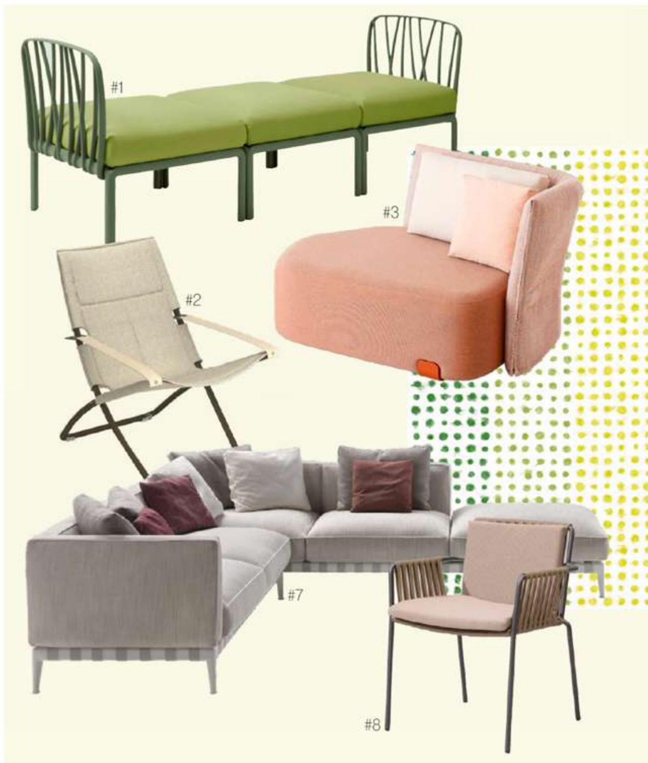
#1 Banquette modulaire 'Komodo', structure résine et fibre de verre, l. 210 cm, 1 231 €, Nardi. #2 Fauteuil pliant 'Snooze', structure acier tubulaire, 199 €, Emu. #3 Module d'assise 'Isla Arosa', design Sebastian Herkner, structure alu, textile technique, 141 x 106 x 80 cm, 4 165 €, Gerni. #4 Chaise longue 'Senja', design Studio Segers, structure alu, 205 x 75 x 85 cm, à pd 3 120 €, (coussins et housse incl), Tribù. #5 Fauteuil avec tablette 'Lily Lounge Armchair', 950 €, Dabla. #6 Chaise 'David Dining Armchair', teck et corde polypropylène, 588 €, Vincent Sheppard.